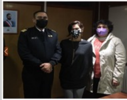
Marzo 27 de mayo de 2022 Gobernación Marítima de Castro AMICHILE se reúne con el Gobernador Marítimo de Castro para delinear un plan de trabajo a desarrollar en la mitilicultura