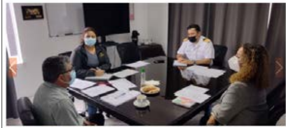
Marzo 23 de mayo de 2022 Gobernación Marítima de Caldera Gobernador Marítimo de Caldera sostuvo reunión con Dirección del Trabajo de Atacama