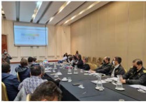
Gobernación Marítima de Punta Arenas Gobernación Marítima de Punta Arenas participó en reunión de pesca artesanal y empresas productoras de salmón