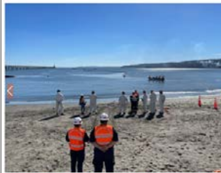
Mayo 17 de mayo de 2022 Capitanía de Puerto del Quilón Capitanía de Puerto de Lirquén participa en ejercicio de contaminación