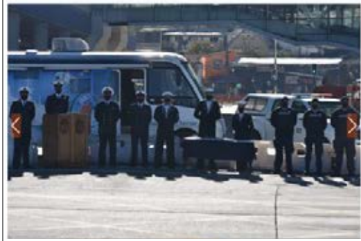
Mayo 17 de mayo de 2022 Gobernación Marítima de Puerto Montt Armada efectuó simulacro de búsqueda y rescate en bahía de Puerto Montt